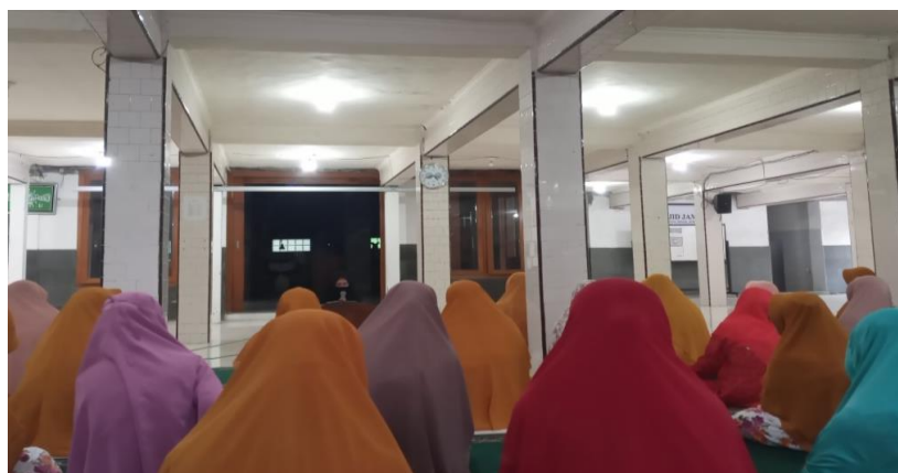
Pengajian rutin ibu-ibu kams sore