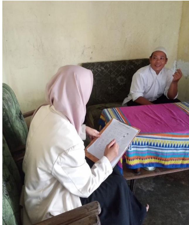
Wawancara Jama'ah Tarekat Syadziliyah Al-Mas'udiyah 2