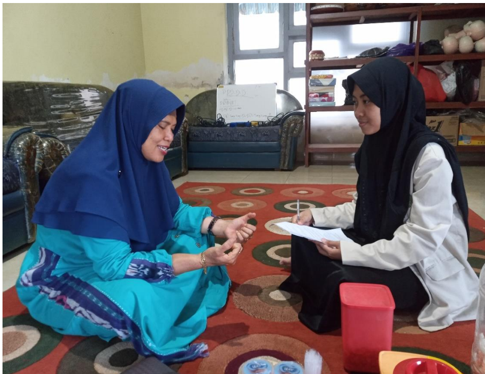
Wawancara Jama'ah Tarekat Syadziliyah Al-Mas'udiyah 1