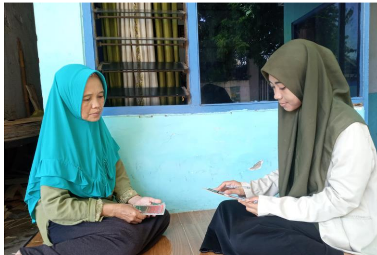
Wawancara Jama'ah Tarekat Syadziliyah Al-Mas'udiyah 3