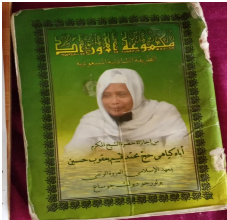
Buku Pedoman Amalan Tarekat Syadziliyah Al-Mas'udiyah