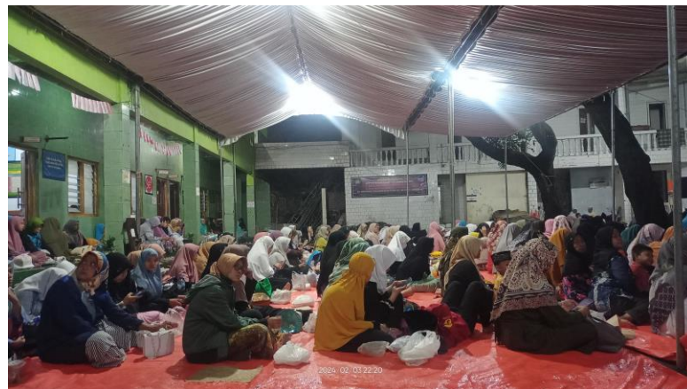
Pengajian Selapanan Tarekat Syadzilyah Al-Mas'udiyah