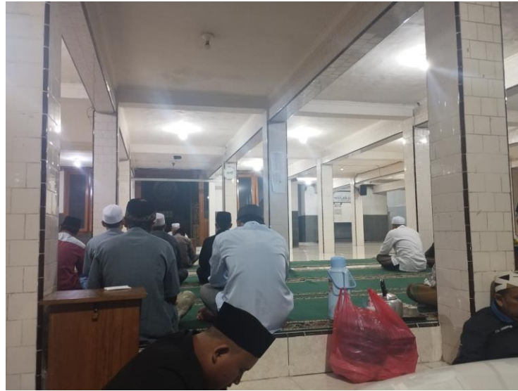
Pengajian rutin bapak-bapak kams malam