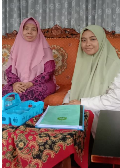
Wawancara Bu Nyai Tarekat Syadziliyah Al-Mas'udiyah