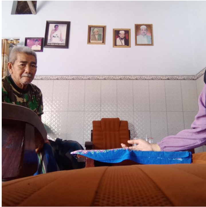
Wawancara Jama'ah Tarekat Syadziliyah Al-Mas'udiyah 4