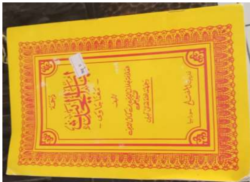
Bahan Pembelajaran Kitab Lubabul Hadist