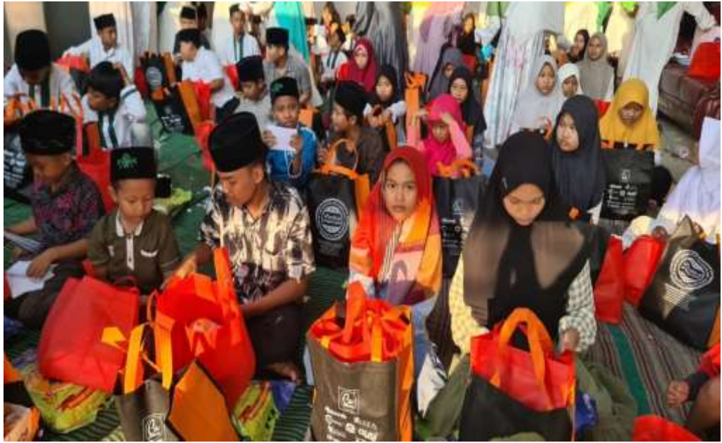
Ibu-Ibu Pengajian Sedang Membagikan Santunan