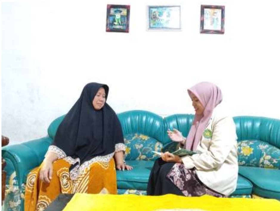
Wawancara Dengan Ibu Pengajian Rutin Kamis Sore