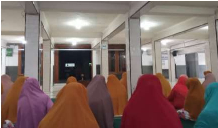
Pengajian Rutin Ibu-Ibu Kamis Sore