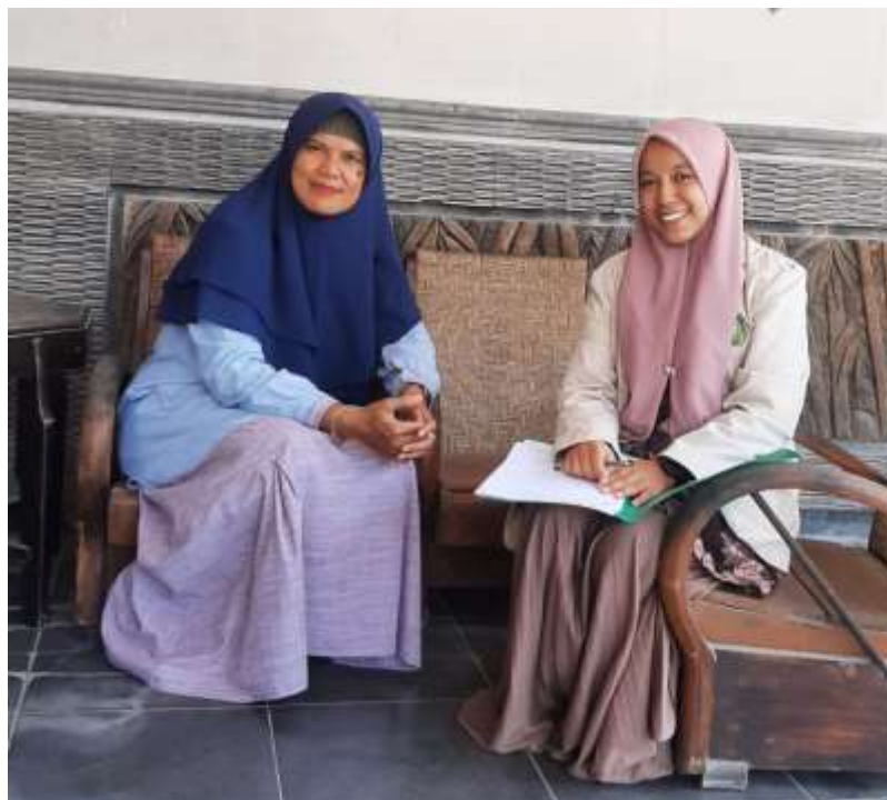
Wawancara Dengan Ibu Pengajian Rutin Kamis Sore