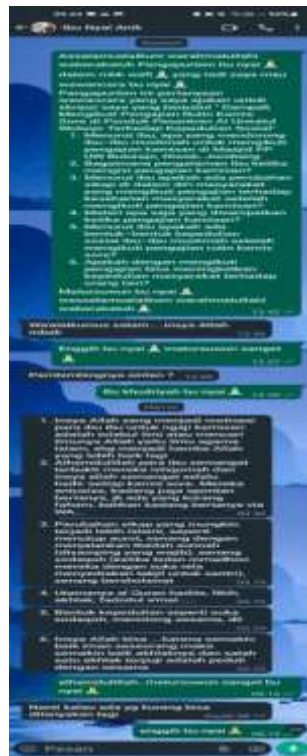
Wawancara Ibu Nyai Yang Mengisi Pengajian Rutin Kamis Sore