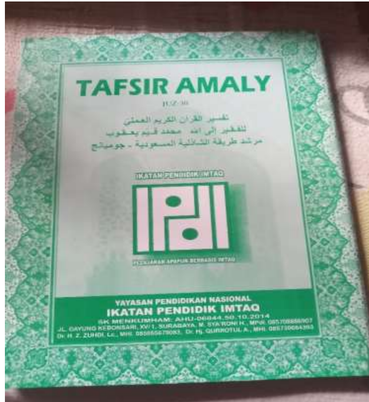
Bahan Pembelajaran Kitab Tafsir Amaly