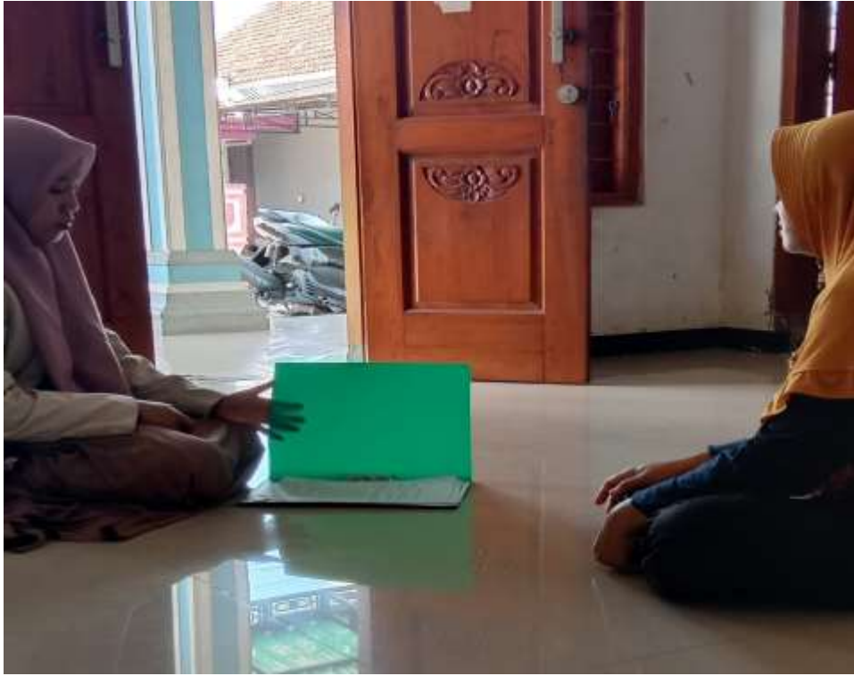
Wawancara Dengan Ibu Pengajian Rutin Kamis Sore