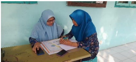
Proses Absensi Digital Pagi