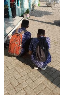
Jalan Jongkok Dari Gerbang Sapai Musholla