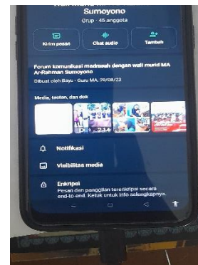
Grup Wali Murid