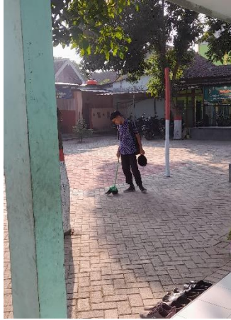
Membersihkan Halaman atau Toilet