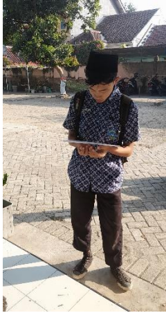
Membaca Asmaul Husna atau Membaca Al-Qur'an