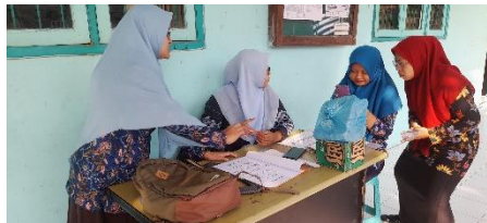
Proses Absensi Digital Waktu Pulang