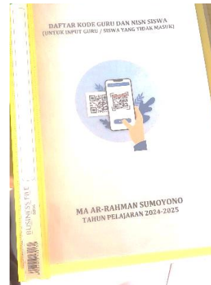
Buku Cadangan Kartu Digital