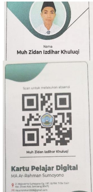
Kartu Absensi Digital