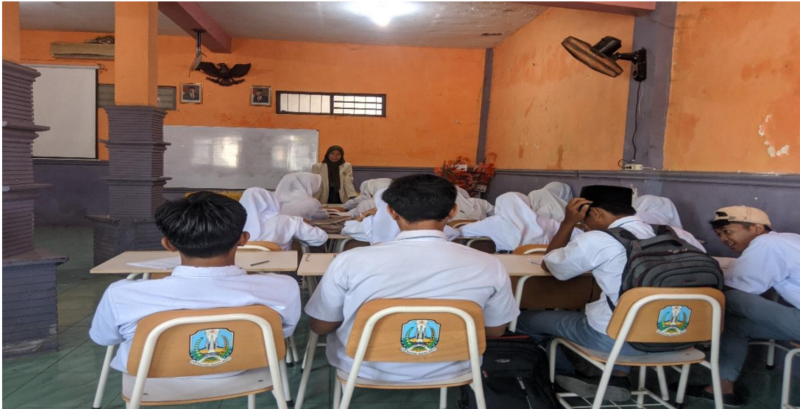
Siswa kelas XI SMK Matsna Karim Bulurejo Diwek Jombang ketika melakukan pembelajaran