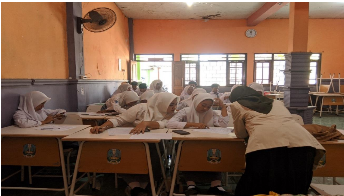
Siswa kelas XI SMK Matsna Karim Burejo Diwek Jombang ketika melakukan pembelajaran