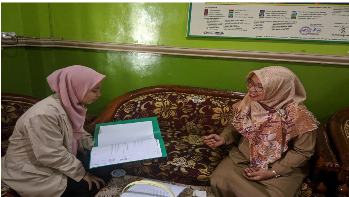
Wawancara dengan guru PAI SMK Matsna karim Bulurejo Diwek Jombang