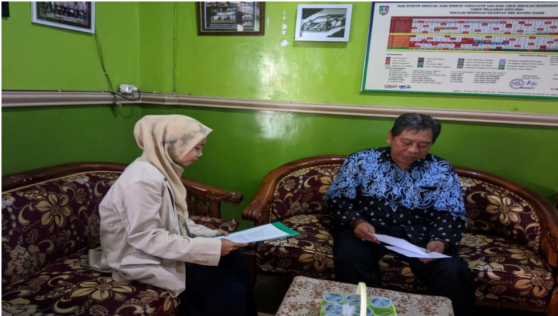
Wawancara dengan kepala sekolah SMK Matsna Karim Bulurejo Diwek Jombang