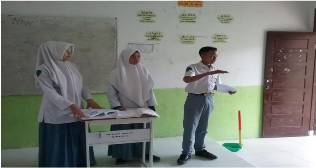
Siswa kelas XI SMK Matsna Karim Bulurejo Diwek Jombang ketika presentasi di depan kelas