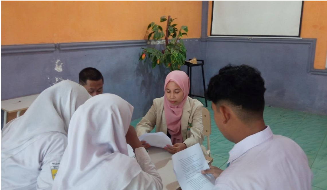
Wawancara dengan siswa SMK Matsna Karim Bulurejo Diwek Jombang