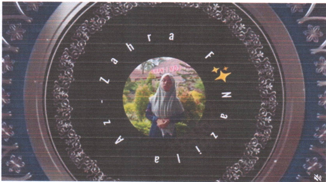
Tugas membuat video dari canva