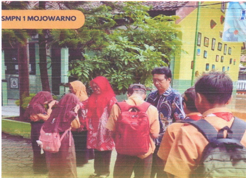
Kegiatan pembiasaan salaman pagi hari