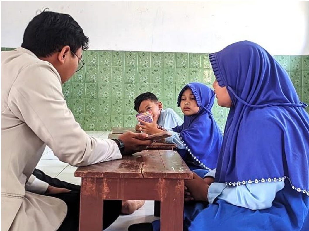
Gambar Wawancara dengan anak-anak kelas 3