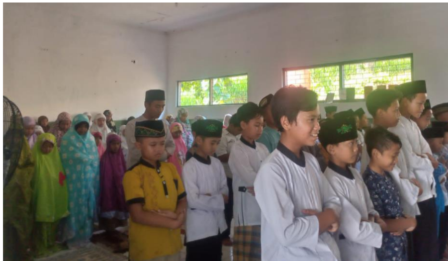
Gambar Sholat dhuha berjama'ah