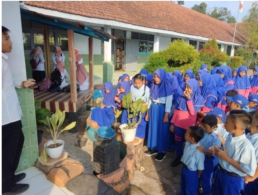
Gambar Kegiatan pembiasaan