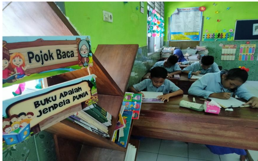
Gambar Pojok buku sarana pendukung implementasi P3