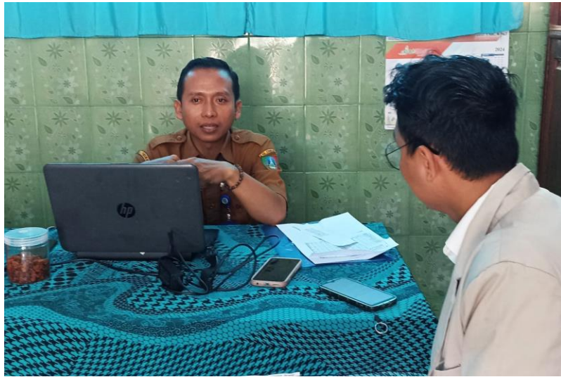
Gambar Wawancara kepada Kepala sekolah