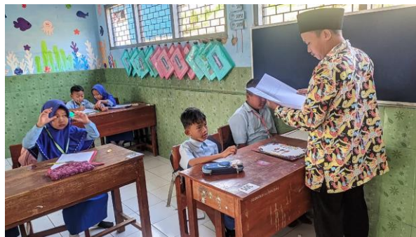
Gambar Pengamatan saat di dalam ruangan kelas 3