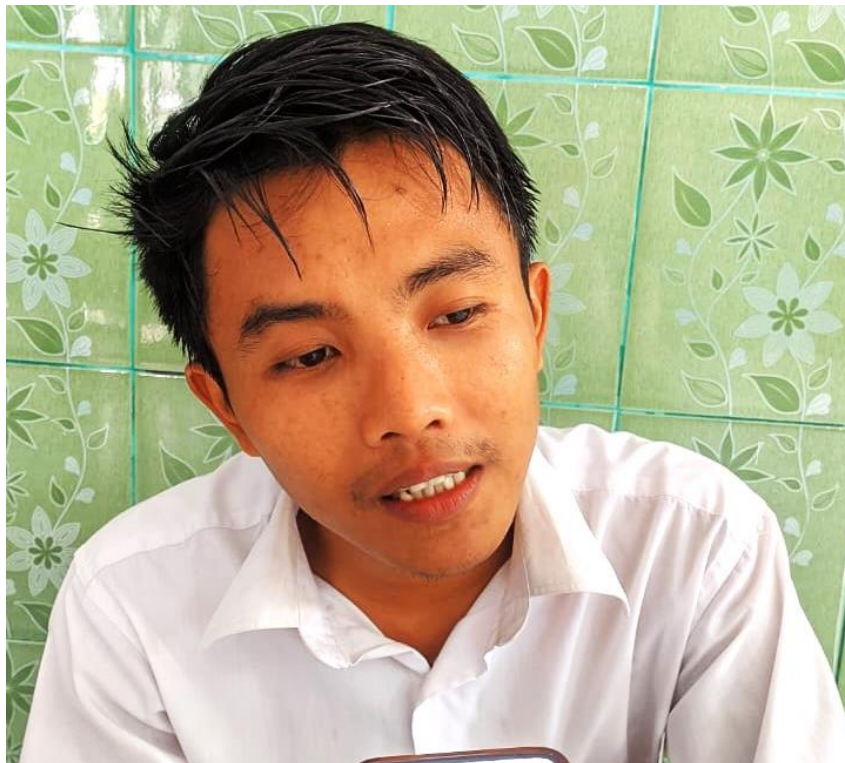
Gambar Wawancara kepada Guru Moluk Keagamaan