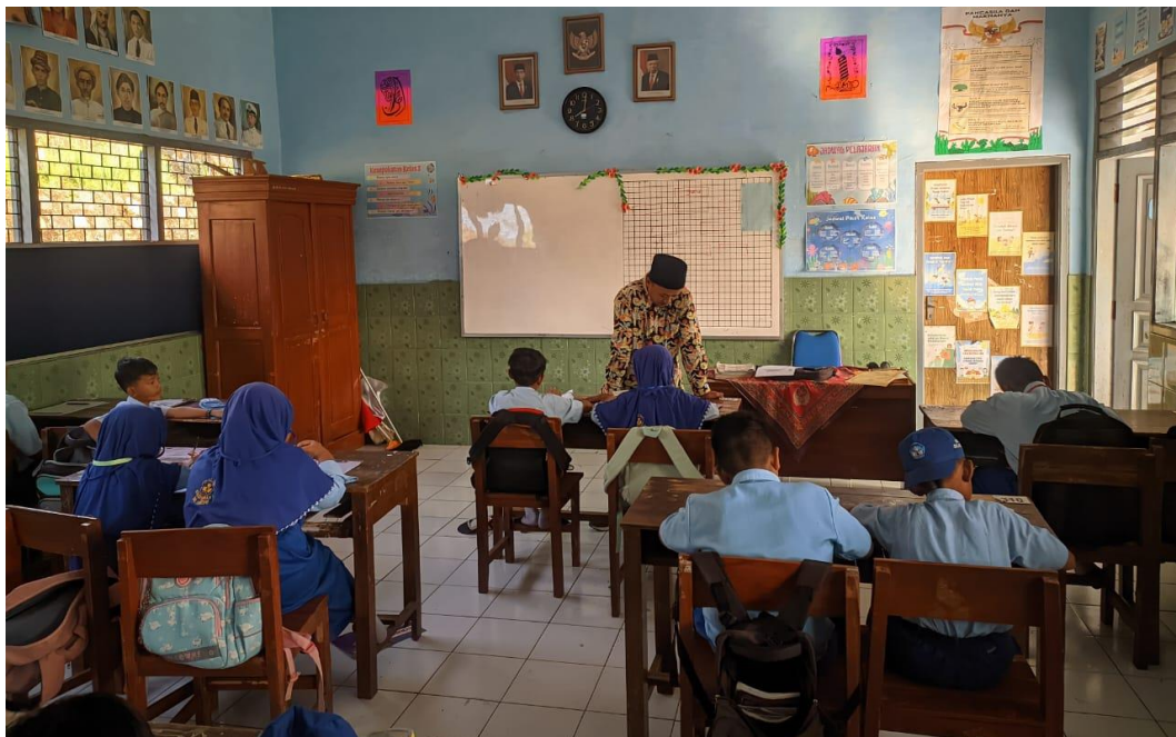
Gambar Suasana pembelajaran PAI