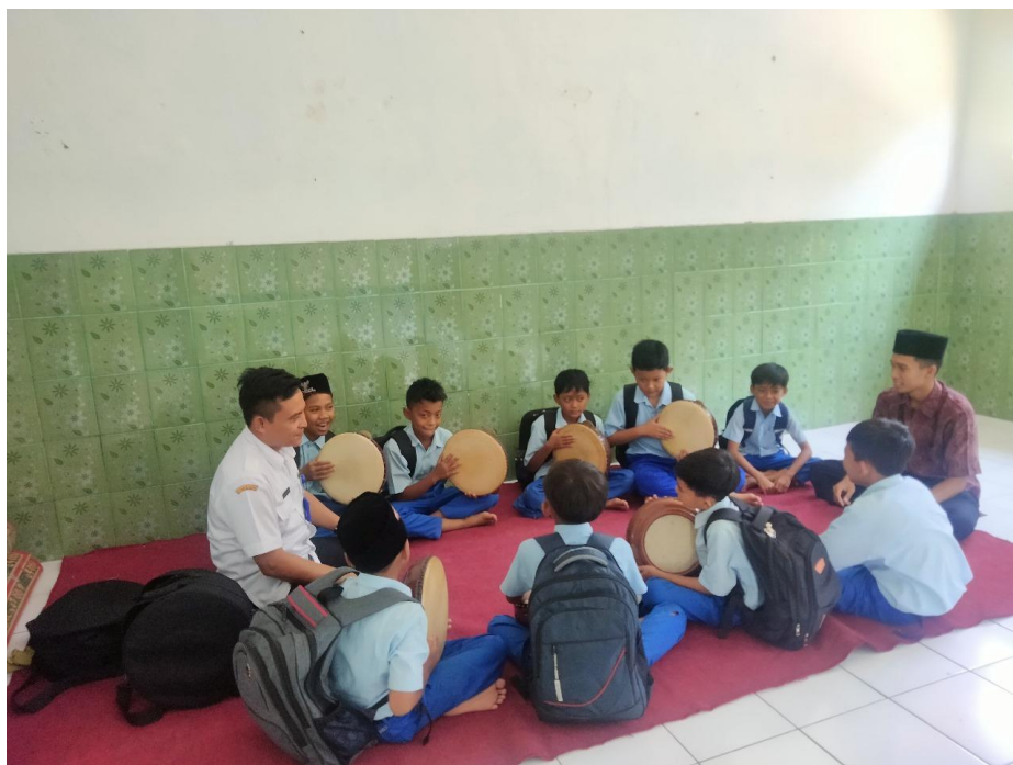
Gambar Latihan banjari