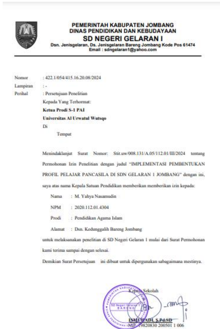
Gambar Surat Balasan penelitian