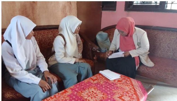
Wawancara kepada Peserta Didik