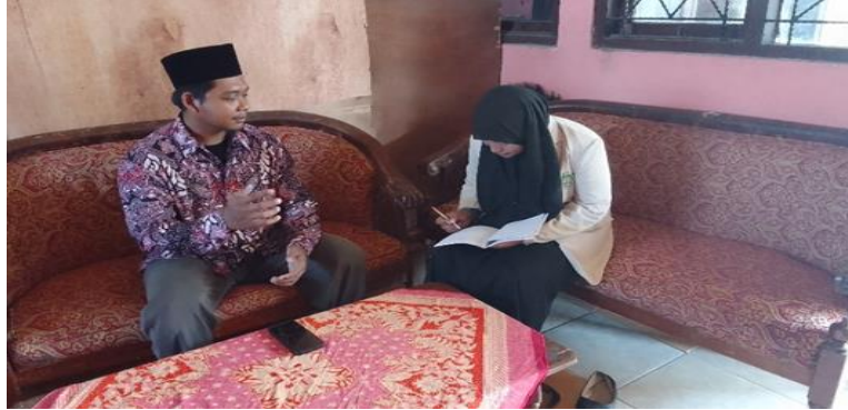
Wawancara Kepada Guru PAI