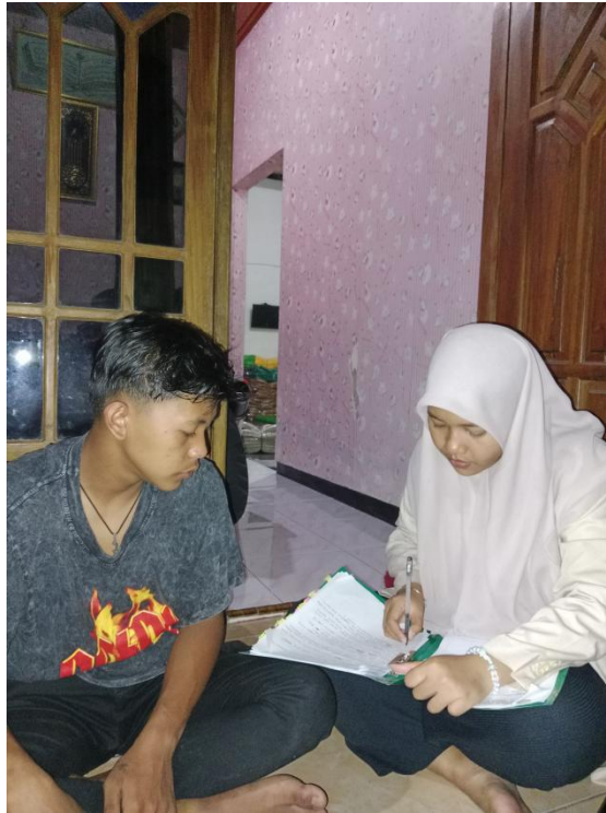
(Dokumentasi wawancara dengan generasi Z)