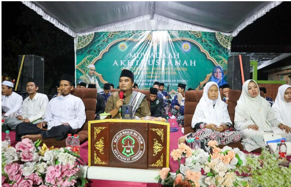
(Pembeda dari konten kreator dakwah di iringi sholawat)