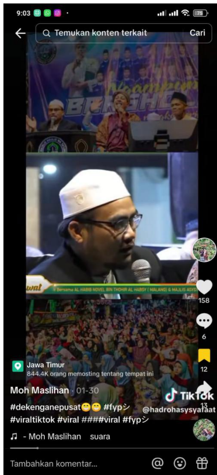
(Video ketika beliau dakwah dan pengeditannya)