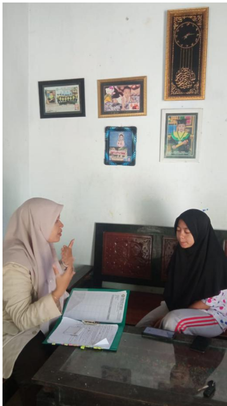
(Dokumentasi wawancara dengan generasi Z)