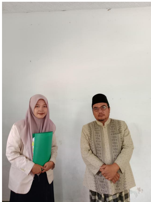
(Dokumentasi dengan konten kreator @mohmaslihan)