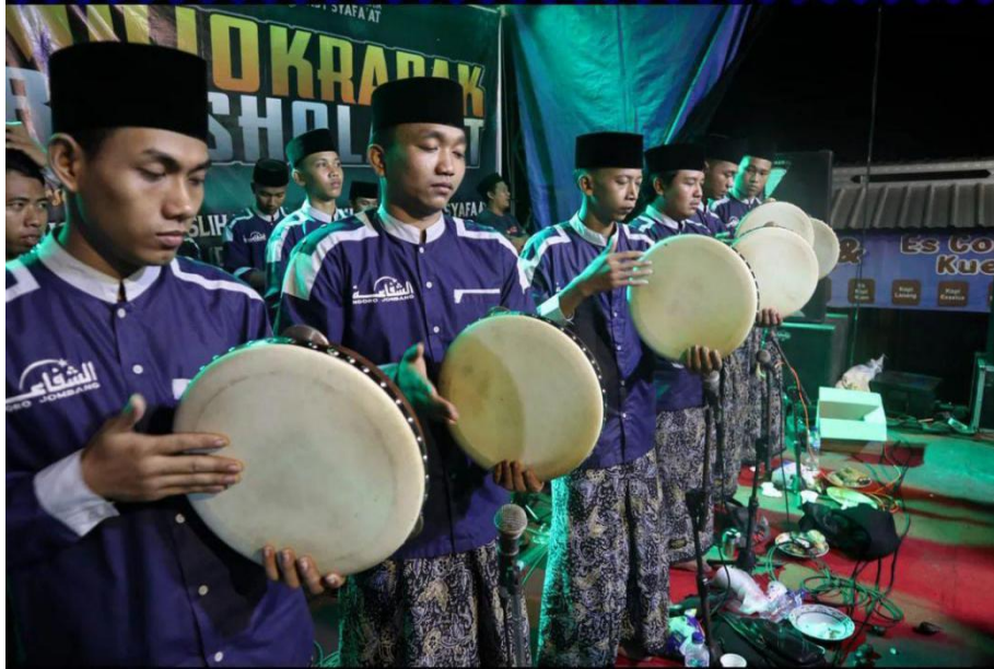
(Sarana Penunjang dari konten kreator)