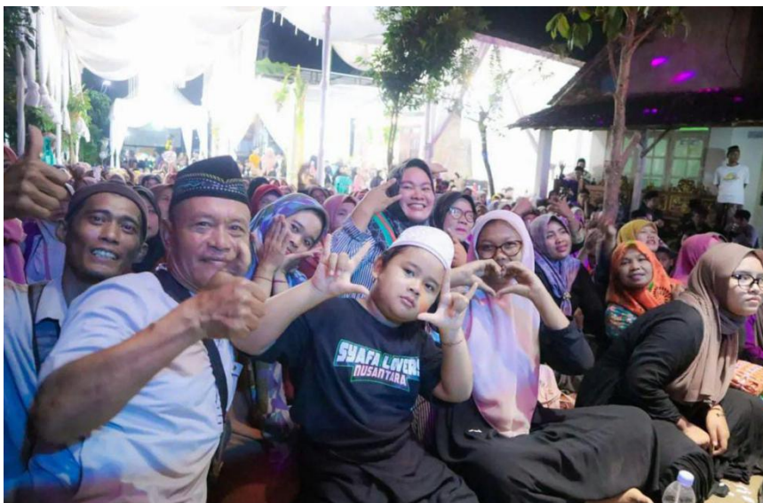
(Jama'ah yang hadir ketika beliau dakwah)