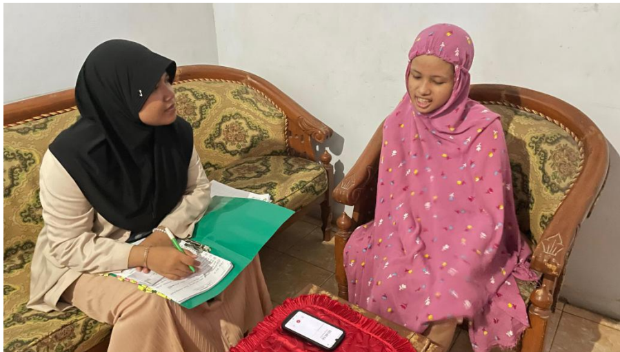
(Dokumentasi wawancara dengan generasi Z)