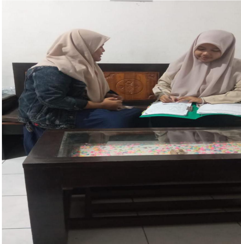
(Dokumentasi wawancara dengan generasi Z)